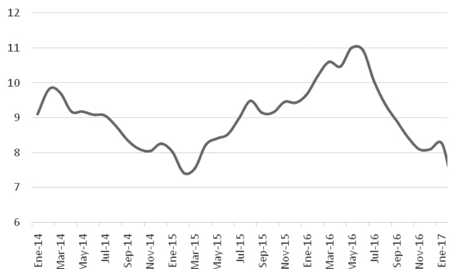
Inflación (%), últimos doce meses